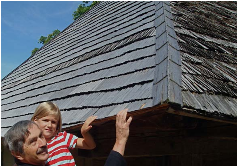
Alphütte (Alpkäserei im Eriz) mit typischem Patina-Schindeldach

Der Grund für den ständigen Rückgang des Schindelmacher-Handwerks in unserer Region ist wohl nicht die in der Urkunde erwähnte Unordnung im besagten Gewerbe. Die von der Obrigkeit 1507 erneuerte Ordnung sorgte da wieder für klare Verhältnisse. Wir vermuten, dass der Rückgang eher die Folge der wachsenden Brandgefährdung der Dorfgemeinschaften war mit Zunahme von Holzhäusern und steigenden Bevölkerungszahlen (Bevölkerung Steffisburg im Jahr 1764: 924 / anno 1799: 1'503 P. / anno 1830: 3'160 / anno 1900: 4'829 Personen). Damit stieg auch die Gefahr des unkontrollierbaren Flächenbrands bei Brandausbruch in einem Haus mit Schindeldach. Solche Dorf- und Stadtbrände sind in unserer Region bekannt und in prägender Erinnerung geblieben (z.Bsp. Dorfbrand Oberhofen 26. Okt.1864; dabei verbrannten u.a. 35 Wohnhäuser & 105 Familien mit 414 Personen wurden obdachlos. Das führte