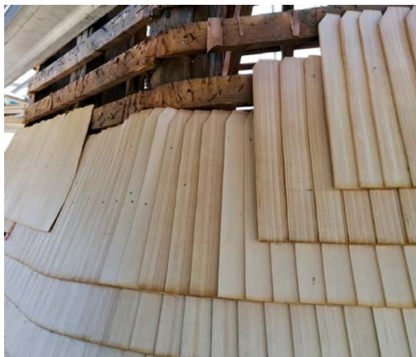
neugelegte Holzschindeln am Kirchturm von Tafers

Das Schindelmacher-Handwerk, vor einigen Jahren noch am Aussterben, ist heute wieder gefragt und Schindeldächer erfreuen sich wachsender Beliebtheit. Auch im Freilichtmuseum Ballenberg wird das Wissen um das Schindeldach in Kursen weitergegeben. Und es gibt Lehrstellen (FR,GB), wo das Handwerk noch erlernt werden kann; dieses erlebt aktuell eine Renaissance im Zeitalter eines umweltbewussten, ökologisch naturnahen und Ressourcen schonenden Lebensstils. So werden alte Kirchtürme wieder mit Holzschindeln neu eindeckt (Tafers, FR).