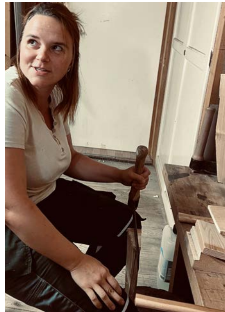
die Schindelmacherin am Werkplatz

Was man vorallem braucht ist ein Gschpüri für Holz; ein gutes Verständnis für das besondere Naturprodukt, um damit arbeiten zu können. Schon als Drechslerin habe ich gelernt mit Holz zu arbeiten. Wichtig ist, immer mit dem Holz zu arbeiten und nicht dagegen; d.h. sich auf das Holz einlassen zu können.