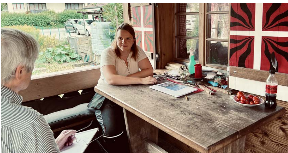
Die Schindelmacherin vom „Fabriggli“ Steffisburg beim Interview in ihrem Gartenhaus