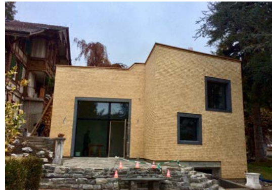
Fassaden-Schindeln an modernem Haus

Holzschindeln sind stets isolierend, dauerhaft und feuchtigkeitsregulierend, zudem umweltfreundlich und bauästhetisch sehr wirksam; sie ergeben ein warmes Gebäude mit Charme und sind ein höchst zeitgemässer Baustoff. Die Verwendung von Holzschindeln als Wetterschutz von Gebäuden, Fassaden ist natürlich, hat Tradition schingle.ch und ist auch bei modernen Häusern gut möglich!