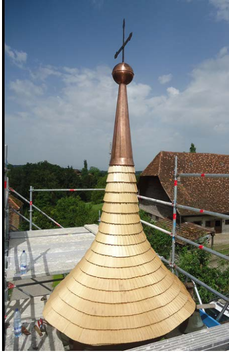
neues Schindeldach am Kirchturm Tafers

Die „Schindelmacher vom Gantrisch“ ( „schingle.ch“ ) gaben dem Kirchturm von Tafers mit ihrem uralten und zugleich topmodernen Handwerk und grossen Können ein neues, höchst beeindruckendes Outfit ! Das neue Schindeldach hält jetzt wieder 50 Jahre.