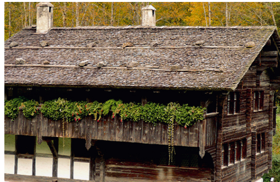
mit Steinen beschwertes Schindeldach, Ballenberg

es nur mit der Axt, dem Spaltkeil (Klotzeisen) und Schindelmesser möglich, das Holz zu spalten. Schon römische Schriftsteller, wie Tacitus und Plinius, berichten von schindelgedeckten Holzhäusern germanischer Völker. Aus römischer Zeit stammt auch das Lehnwort Scindula für Schindel (lat. Scandula , Scindula ) aus dem lat. Verb scindere , was spalten heisst. Auch bei aussereurop. Völkern (Indianern) war