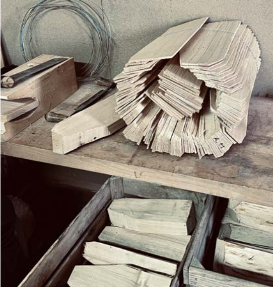
gebündelte Holzschindeln, zum Verlegen bereit

vorhandenen Aufträgen. In der Westschweiz wird mehr geschindelt als hier; solche Arbeiten werden auch mehr subventioniert, zum Beispiel im Kanton Freiburg. Zu Aufträgen kommt man am ehesten über alte Schindelmacher, die aufhören und den Kundenstamm weitergeben möchten, damit das alte Handwerk erhalten bleibt.