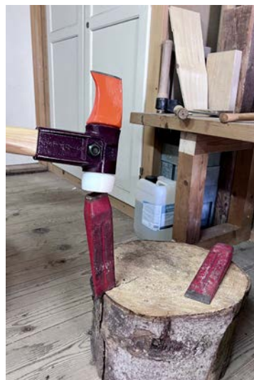
„Rugele“, mit dem Keil gespalten

Der grosse Hit wird es vielleicht nicht sein. Schindeldächer sind kostspielige Dächer, aber über's Ganze gesehen (bez. Lebensdauer, Qualität, Umweltverträglichkeit, Komfort) sind es vertretbare Preise. Heute hat zu Schindeldächern ein Umdenken stattgefunden. Die Bevölkerung ist sensibilisiert für die grosse Bedeutung und nachhaltige Wirkung von Schindeln im Häuserbau. Es werden sogar Schindeln aus Eschen- und Kastanienholz für anspruchsvolle Objekte gebraucht. An einer Holzfachtagung (2021) im Berner Oberland wurden neuartige Anwendungsbeispiele von Schindeln im modernen Häuserbau vorgestellt.