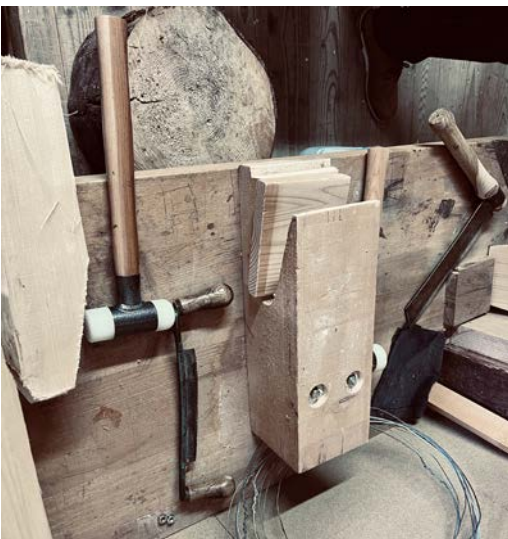
Werkzeuge der Schindelmacherin

Zum Schindeln werden die in den Wintermonaten (Dezember-Januar-Februar) geschlagenen Stämme mit der Rinde genommen und in Nähe vom Verarbeitungsort gelagert. Der Stamm wird dann mit der Kettensäge in sog. Rugele geschnitten von etwa 47 cm Länge und auf der Fräse die entrindeten Stücke im Winkel geschnitten, um eine Schindellänge von 45 cm oder 33 cm zu erhalten. Füessler-Schindeln , die (am Dachkännel entlang) zuerst und sehr eng verlegt werden müssen, sind nur 20 -25cm lang. Als Standard für die Dicke der Schindeln gilt ein Mass von 5-6mm. Dickere Schindeln, wie Brett-schindeln , werden gebraucht für Fassaden und halten gut 100 Jahre lang.